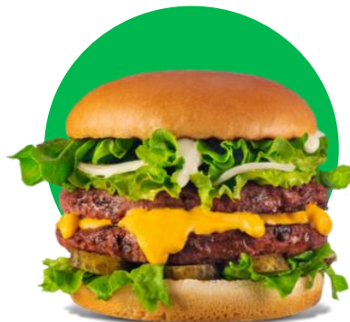
Imagine cu titlu de prezentare