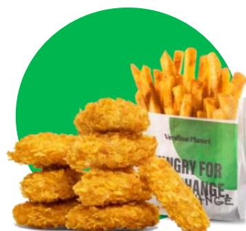
Imagine cu titlu de prezentare