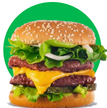
Imagine cu titlu de prezentare