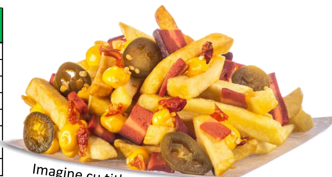
Imagine cu titlu de prezentare