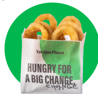
Imagine cu titlu de prezentare