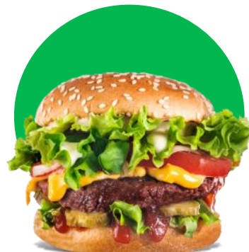
Imagine cu titlu de prezentare