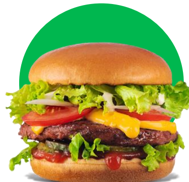
Imagine cu titlu de prezentare