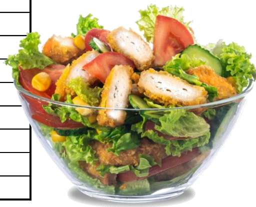
Imagine cu titlu de prezentare