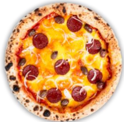
Imagine cu titlu de prezentare