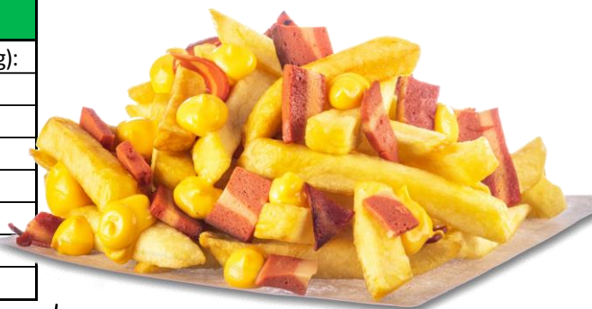
Imagine cu titlu de prezentare