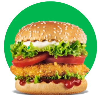
Imagine cu titlu de prezentare