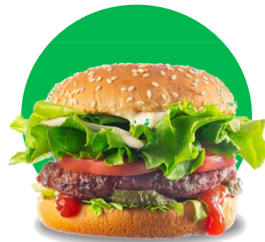
Imagine cu titlu de prezentare