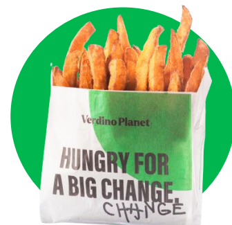
Imagine cu titlu de prezentare