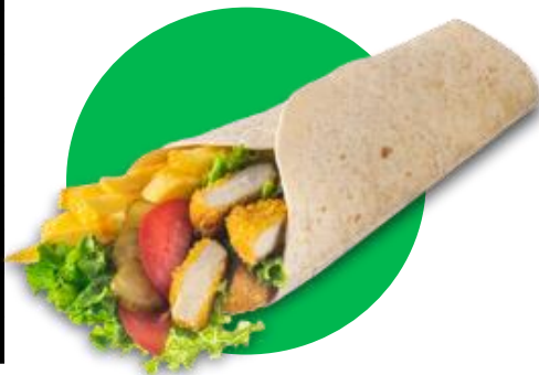
Imagine cu titlu de prezentare