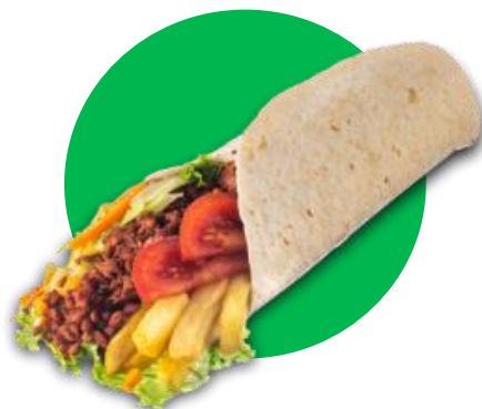
Imagine cu titlu de prezentare