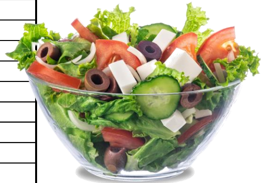
Imagine cu titlu de prezentare