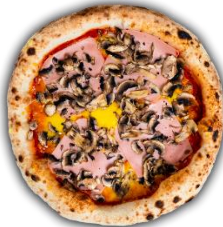
Imagine cu titlu de prezentare