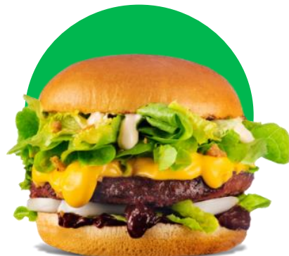
Imagine cu titlu de prezentare