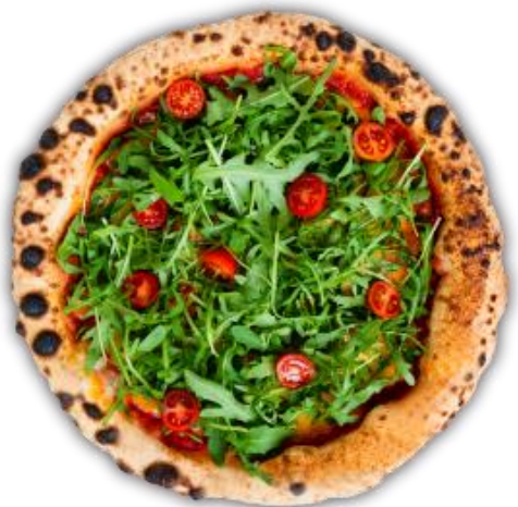
Imagine cu titlu de prezentare